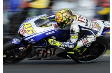
A sinistra Valentino Rossi con l'Aprilia 125 nel 1997. Qui sopra con la Yamaha nel 2009.